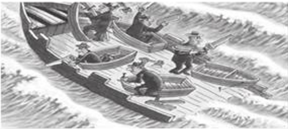
自利,只会一起沉没